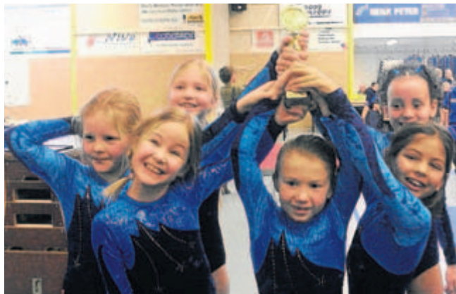
Trotse tunstertjes van 6 tot 8 jaar van Hygiëa na het turnkamp in Bunschoten.

ZEIST - Elk jaar organiseert turnvereniging ZGV Hygiëa uit Zeist samen met SV Fraternitas uit de Bilt een 3-4 turnkamp voor de recreatieve meisjes en jongens uit de hele regio. De voorrondes voor deze wedstrijd zijn in Bunschoten gehouden. Op 3 of 4 toestellen turnden de kinderen in groepjes hun oefening. Tijdens deze gezellige, sportieve groepswedstrijd, waarbij het plezier voorop staat en meedoen belangrijker is dan winnen, scoorde Hygiëa dit keer toch wel heel erg sterk. Van de 9 ploegen die met de vereniging op pad gingen, bereikte er maar liefst 5 een finale-