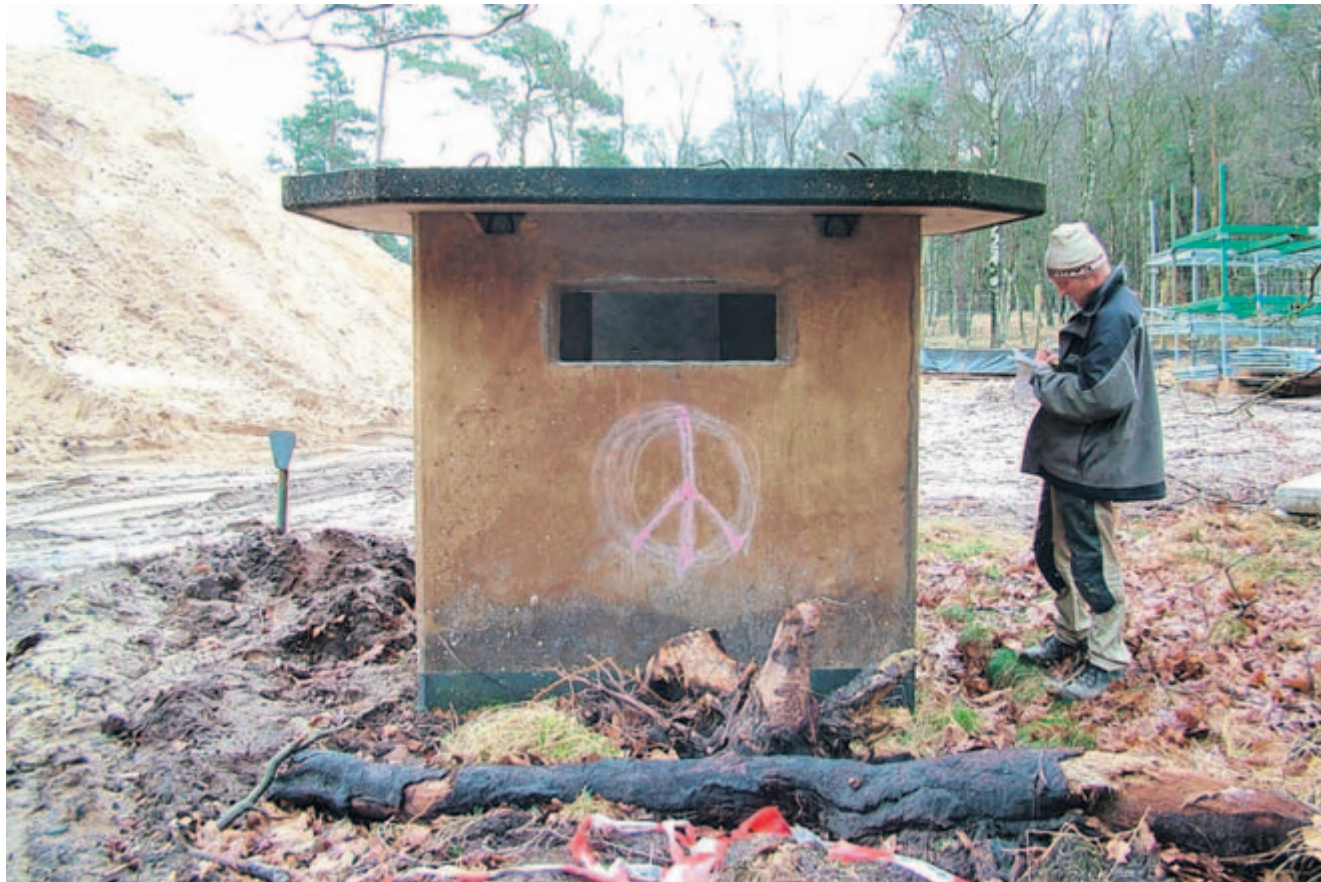
Taas van Herpen neemt de maten op van voormalig Wachthuis Soesterberg dat door hem en Remco de Kluzenaar tot dierenverblijf omgebouwd zal worden. Een fauna bevorderend kunstobject.

DEN DOLDER - Vlakbij station Den Dolder, op het voormalige militaire vliegbasis Soesterberg terrein voltooit Prorail de komende 2 maanden een ecoduct, het Eco-duct op Hees. Hiermee zorgt het bedrijf dat voor onder andere NS de sporen aanlegt en onderhoudt, voor een oversteekplaats voor muizen, herten en ander wild over hun spoorlijn tussen Amersfoort en Utrecht. Twee Wageningse creatieve bouwers kregen daarbij een bijzondere opdracht: Vlakbij de overweg voor fietsers over het ecoduct staat een betonnen wachthuisje.